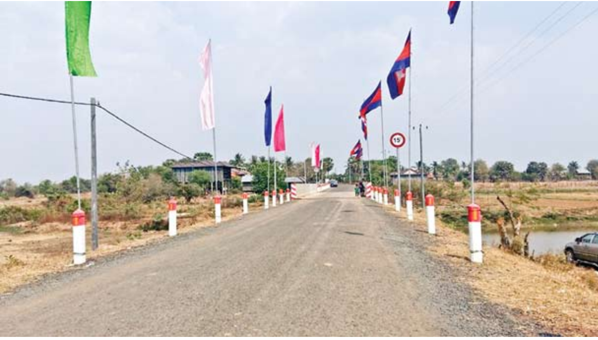
ការផ្សារភ្ជាប់ប្រជាជនទៅនឹងទីផ្សារ ផ្លូវចម្ងាយ២០០០គីឡូម៉ែត្រដែលបានសាងសង់ដោយជំនួយពីអាណ្លីម៉ង់។

លោកឡាយ ប៊ុនគីជាបុរសពោះម៉ាយម្នាក់ដែលរស់នៅភូមិដាច់ស្រយាលមួយនៅក្នុងខេត្តកំពង់ឆ្នាំង។ គាត់បានបាត់បង់ប្រពន្ធរបស់គាត់ដោយសារតែពស់ចឹក អំឡុងពេលដែលប្រពន្ធរបស់គាត់សម្រាលកូន។ ផ្លូវលំដែលតភ្ជាប់ផ្ទះរបស់គាត់ទៅផ្លូវជាតិក្នុងស្ថានភាពមិនល្អ និងលិចទឹកនៅរដូវវស្សា។