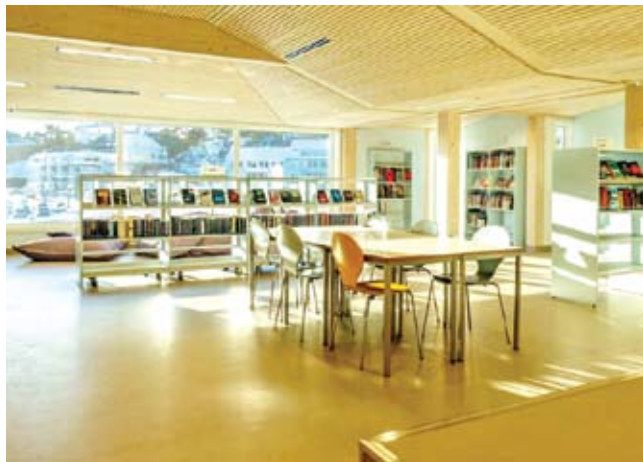
សាលារបស់ក្រុមហ៊ុន MJQE ទាំងអស់ត្រូវបានសម្អាតជាប្រចាំ។