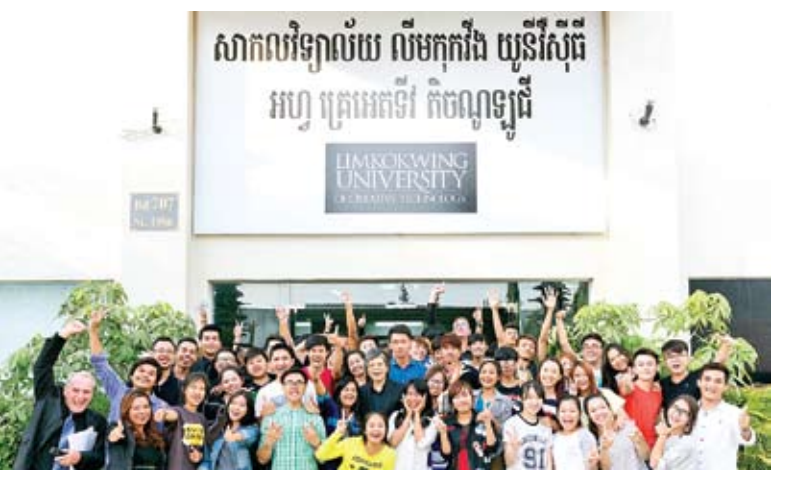
សាកលវិទ្យាល័យ លីមកុកវីង មានទីតាំងស្ថិតនៅក្នុងរាជធានីភ្នំពេញ។