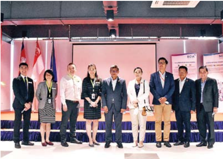
សាលា SCIA ព្យាយាមនាំមកនូវការអប់រំស្តង់ដារសិង្ហបុរីសម្រាប់សិស្សានុសិស្សកម្ពុជា។

ក្នុងអំឡុងពេលវិស្សមកាល វាចាំបាច់ណាស់សម្រាប់សិស្សានុសិស្សត្រៀមខ្លួនសម្រាប់ឆ្នាំសិក្សាថ្មី។ ការវិលត្រឡប់ទៅកាន់សាលារៀនវិញអាចពិបាកបន្តិចសម្រាប់សិស្សដែល