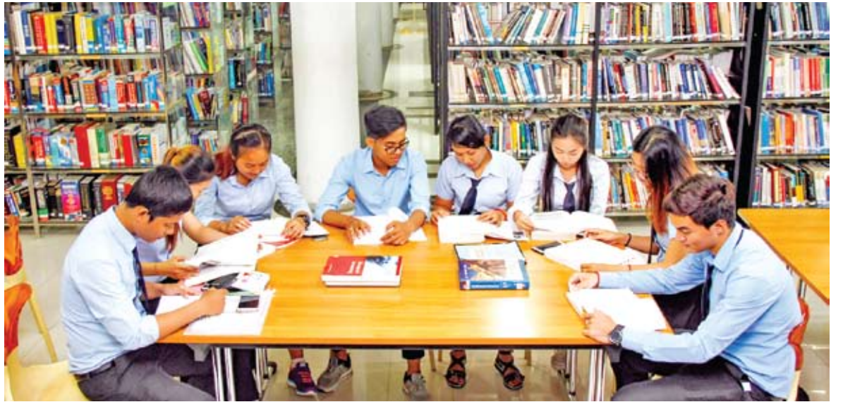
ប្រព័ន្ធគ្រូពីនិក្ខពិសេស នឹងត្រូវដាក់ដើម្បីតាមដានវត្តមាន។

ជាមួយគ្នានេះដែរ គណៈកម្មការបច្ចេកទេសក៏បានធ្វើការកែទម្រង់លើប្រព័ន្ធដាក់ព័ន្ធខ្លះៗ គឺយើងធ្វើការ