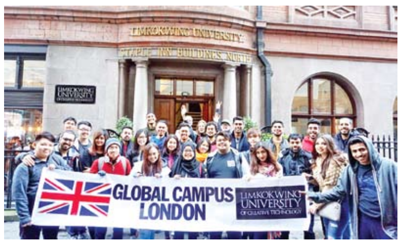
សាកលវិទ្យាល័យ លីមកុកវីង មានសាលានៅ១៣ប្រទេស។