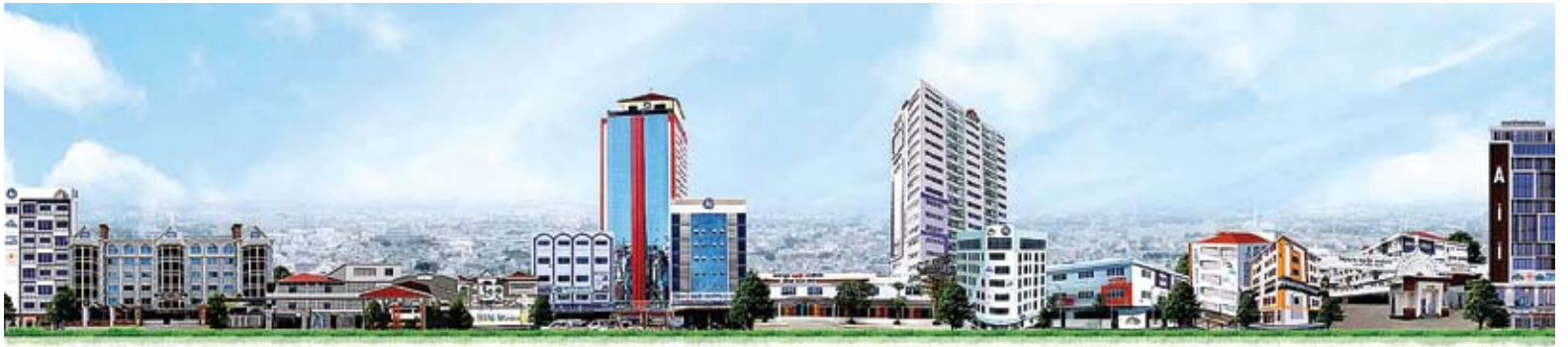
ក្រុមហ៊ុន MJQE គឺជាក្រុមហ៊ុនមេនៃមជ្ឈមណ្ឌលភាសា អេ អាយ អាយ (Aii) និងសាលារៀនអន្តរទ្វីបអាមេរិកាំង (AIS) ដែលមានសិស្សចូលរៀន ១៤ ៥០០ នាក់។

“ការប្រកាសនេះគឺជាដំណឹងល្អ សម្រាប់វិស័យនេះ និងសម្រាប់សា-