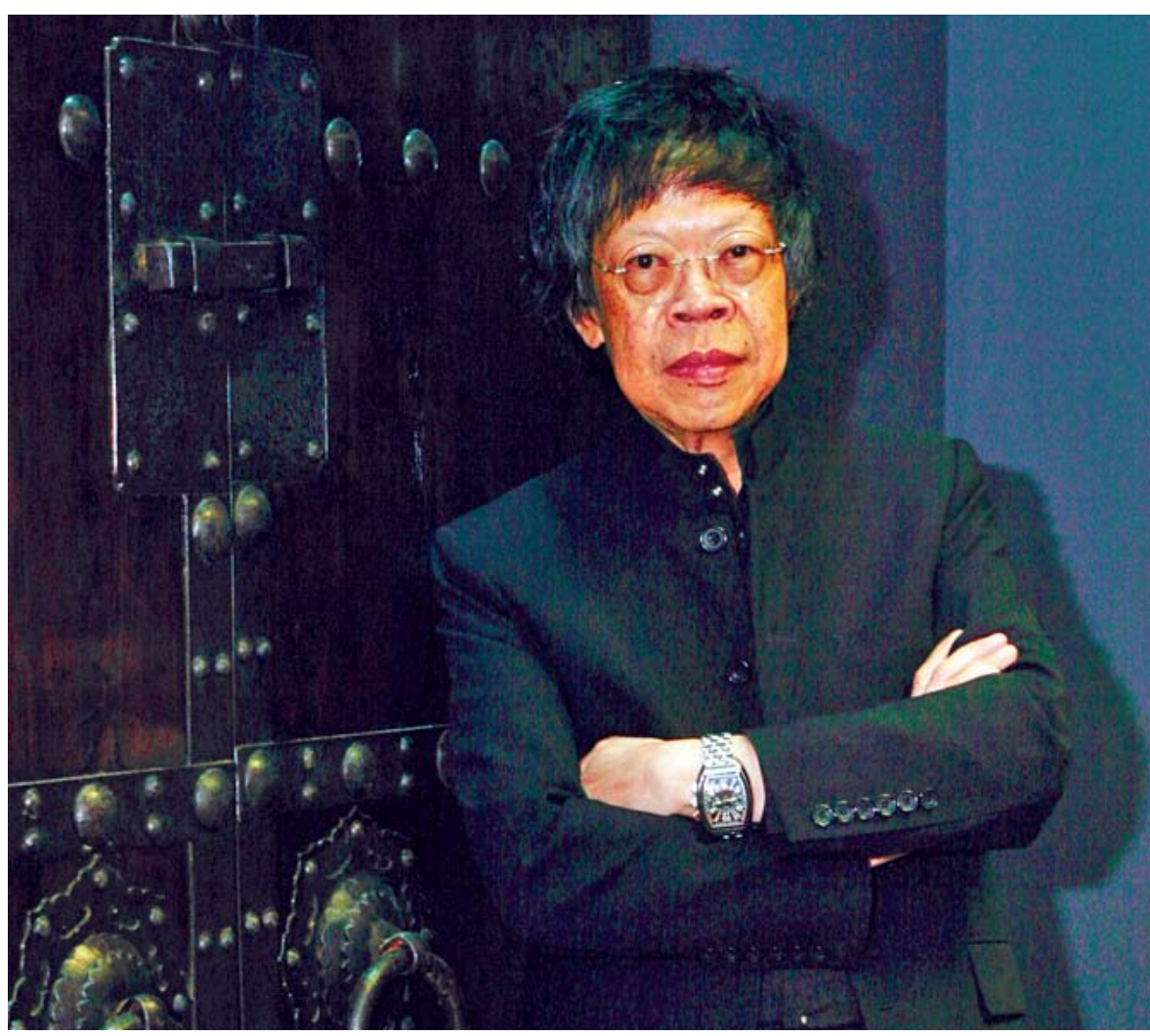
លោក Lim Kok Wing ស្ថាបនិក និងជាប្រធានសាកលវិទ្យាល័យ លីមកុកវីង ដ៏ល្បីល្បាញ។

ទស្សនៈដំបូងនៃពាក្យច្នៃប្រឌិតត្រូវតែយល់ឱ្យបានច្បាស់ ដើម្បីដឹងថា តើហេតុអ្វីបានជាវាជាកត្តាជំរុញដ៏សំខាន់សម្រាប់ការអប់រំនៅសតវត្សរ៍ទី២១នេះ។ ការច្នៃប្រឌិតតែងតែជាធាតុមួយនៃការលូតលាស់របស់មនុស្ស ដែលបានរួមចំណែកដល់របៀបដែលយើងបានរីកចម្រើននៅលើភពផែនដីនេះ។ ការច្នៃប្រឌិតគឺជាទិដ្ឋភាពធម្មជាតិរបស់មនុស្សដែលជំរុញយើងឱ្យអភិវឌ្ឍរបៀបនៃការអនុវត្តបច្ចេកវិទ្យា។ ដូច្នេះយើងបានបង្កើតនិងច្នៃប្រឌិតជាបន្តបន្ទាប់។ សព្វថ្ងៃយើងបានឈានដល់ចំណុចមួយដែលការរីកចម្រើនរបស់យើងបានកើនឡើងយ៉ាងឆាប់រហ័ស។ រាល់ការដើរលឿនផ្នែកបច្ចេកវិទ្យា បានពន្លឿនដល់ការផ្លាស់ប្តូរបន្ទាប់ ដែលយើងបានឃើញនៅក្នុងជីវិតរស់នៅប្រចាំថ្ងៃរបស់យើង។ អ្វីដែលធ្លាប់ចំណាយពេលរាប់ខែត្រូវបានកាត់បន្ថយមកត្រឹមប៉ុន្មានសប្តាហ៍ ហើយបច្ចុប្បន្ន អាចនៅសល់តែប៉ុន្មានវិនាទីប៉ុណ្ណោះ។ ពេលនេះយើងកំពុងឈានដល់ពេលវេលានៃការផ្លាស់ប្តូរដ៏ធំនិងឆាប់រហ័ស ជាមួយនឹងការច្នៃប្រឌិតក្នុងការប្រើប្រាស់បច្ចេកវិទ្យា ភាពលឿននៃប្រព័ន្ធអ៊ីនធឺណិត និងវិទ្យាសាស្ត្រដែលកំពុងនាំពិភពលោកឱ្យឈានដល់យុគថ្មីមួយ។ ច្បាស់ណាស់ ឥទ្ធិពលមកលើមនុស្សជាតិពិតជាធំធេងណាស់ ដូចជាជាមួយនឹងការអប់រំ និងអាជីពការងារដែរ ខណៈបច្ចេកវិទ្យាកំពុងតែទទួលរាប់រងការងារធំៗជាច្រើន។ ឧស្សាហកម្មកំពុងផ្លាស់ប្តូរ ដំណើរការរបស់ពួកគេកំពុងឆ្ពោះទៅរកខ្សែចង្វាក់ថ្មីៗ។ ទោះយ៉ាងណា អ្វីដែលនៅតែជាផ្នែករបស់មនុស្សគឺសមត្ថ-