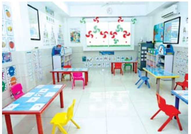
សាលា AIS មានស្តង់ដារអនាម័យខ្ពស់បំផុត។